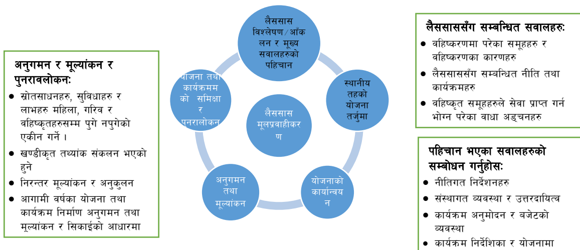
चित्र १ : लैससास मूलप्रवाहीकरण चक्र