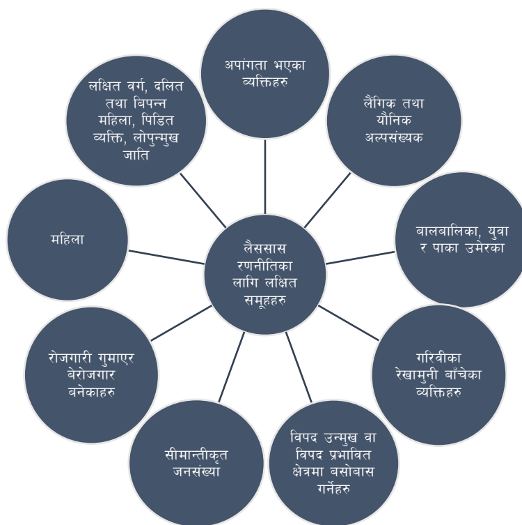
चित्र ४ : जनकपुर उप-महानगरपालिक लक्षित समूहहरु