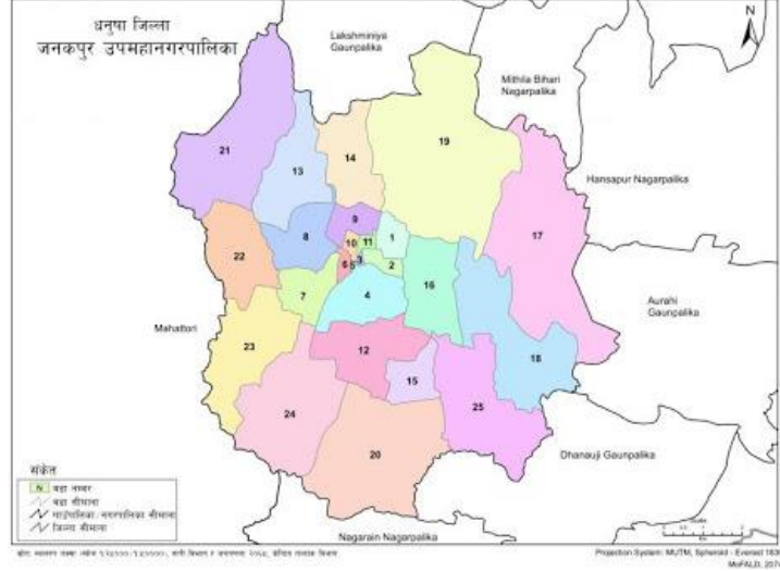
चित्र २ : जनकपुरधाम उपमहानगरपालिका

सन् २०१८ को पछिल्लो अनुमान अनुसार पालिकाको ९१.९७ वर्ग किमी क्षेत्रफलमा १७३९२४ जना मानिसहरु बसोबास गर्दछन्। कृषि विकास मन्त्रालयको प्रतिवेदन अनुसार यहाँको जनसंख्या वृद्धिदर २.२ रहेको छ। जुन बुटवल र पोखरा जस्ता सहरहरुको तुलनामा कम हो। जनसंख्या वृद्धि दरलाई बढ्दो सहरीकरणले प्रभावित गर्ने गरेको छ। त्यसैगरी छेउछाउका वस्तीवाट केन्द्र तिर आउने प्रवृत्ति र बसाई सराईको कारणले पनि जनसंख्या वृद्धिलाई प्रभावित गर्ने गरेको छ। ९ यो नगरपालिका उब्जाउ जमिन लगायत थुप्रै प्राकृतिक स्रोतहरुका हिसाबले धनी छ। तथापि बढ्दो जनसंख्याका कारण कृषियोग्य भूमिको अनुपातमा परिवर्तन भैरहेको छ, काम गर्ने उमेरका मानिसहरु विभिन्न सम्भावना खोज्दै सहर तिर जाने क्रम बढ्दो छ, र धेरै मानिस रोजगारीको खोजीमा विदेश तिर गैरहेका छन्। यस अर्थमा व्यापार, व्यवसाय, धार्मिक पर्यटन, र विप्रेषण नै जनकपुरवासीहरुको आम्दानीका प्रमुख स्रोतहरु हुन्। नगरपालिकाको केन्द्रभाग भन्दा बाहिर रहेका गरिवहरुको अर्भै पनि आम्दानीको प्रमुख स्रोत भनेको कृषि, माछापालन, पशुपालन र विप्रेषण रहेका छन्। नगरपालिकामा रहेको रोजगारको प्रमुख आधार भनेको घर निर्माण कार्य हो।