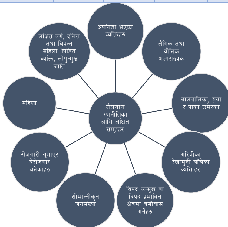
चित्र ४ : जनकपुरधाम उप-महानगरपालिका लक्षित समूहहरु